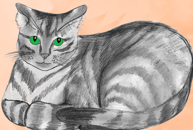
Рис. Е. Логиновой