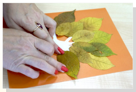
4. Приклеиваем нужное количество листьев, создавая крону дерева.