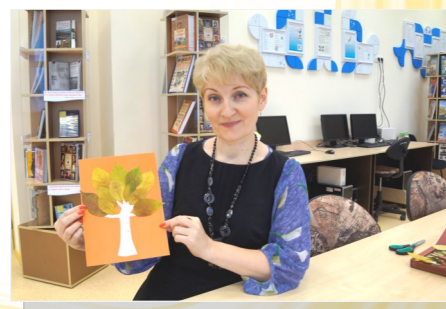
6. Оставим нашу картину на некоторое время, до полного высыхания.

Если у Вас появится желание облагородить или повесить картину на стену, её можно поместить в обычную фоторамочку. Не закрывайте картину стеклом, так она порадует Вас не только внешним видом, но и запахом осенней листвы.