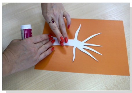
1. Вырезанный ствол березы наклеиваем по центру листа картона — это основа нашей композиции.