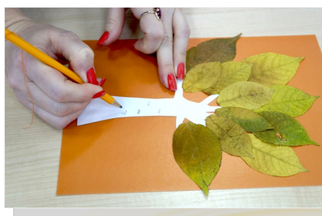
5. Простым карандашом рисуем на стволе короткие черточки, как у берёзки.