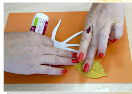
3. Приклеиваем листок березы к основе.