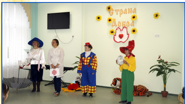
Сказочные герои поздравляют юных читателей

Библиотекари Ханты-Мансийска в очередной раз организовали для ребят путешествие в сказку, где добро всегда побеждает зло.