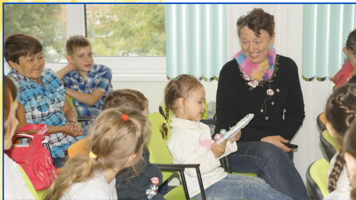
Игра «Передай добро по кругу»

7 сентября 2014 года в библиотеке-филиале № 6 прошел заключительный праздник Программы летнего чтения «В мире добрых дел».