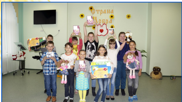
Участники Программы летнего чтения с заслуженными призами

Целое лето дети читали книги о добрых поступках и делах, узнавали народные пословицы и поговорки о добре, слушали