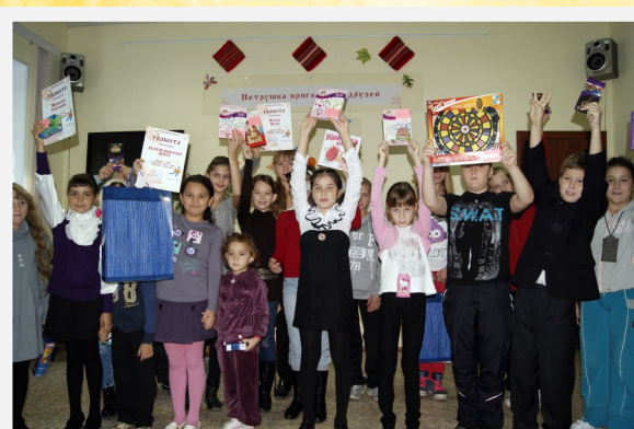
Участники Программы летнего чтения «Каникулы с Петрушкой»

Всего за лето было роздано 180 программ, 45 из которых были сданы в срок до 1 сентября. Именно эти 45 участников были награждены призами.