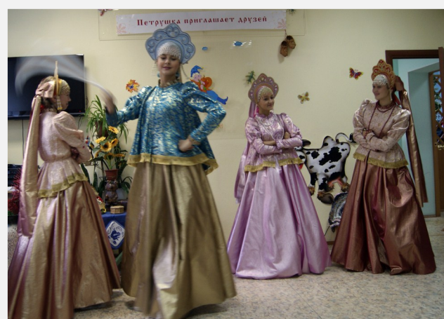
Студия танца «Эксклюзив». Танец «Сибирская вечерка»

знание русского фольклора, народных примет, былин, сказок. Однако творческое задание «Продолжи сказку...» стало решающим в определении победителей. Так же учитывалась аккуратность в оформлении, количество посещений библиотеки, количество прочитанных за лето книг и сроки сдачи. Итогом трёх летних месяцев стал заключительный праздник Программы летнего чтения «Петрушка приглашает друзей».