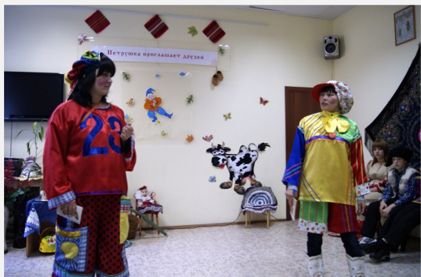
Ведущие начинают праздник

знание русского фольклора, народных примет, былин, сказок. Однако творческое задание «Продолжи сказку...» стало решающим в определении победителей. Так же учитывалась аккуратность в оформлении, количество посещений библиотеки, количество прочитанных за лето книг и сроки сдачи. Итогом трёх летних месяцев стал заключительный праздник Программы летнего чтения «Петрушка приглашает друзей».