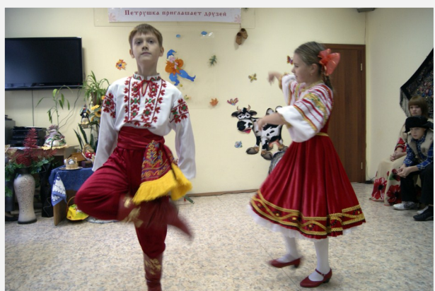
Студия танца «Эксклюзив». Танец «Смоленский гусачок»

Закончилось жаркое лето. Наступила золотая осень. Пришло время подвести итоги Программы летнего чтения «Каникулы с Петрушкой» и собрать урожай призов. Именно по этому поводу и собралась ребятня в Детской библиотеке 16 сентября 2012 года. Напомню, что каждое лето библиотеки города проводят Программу летнего чтения с целью привлечь внимание детей к книге и организовать каникулярный досуг в городе. Шестая Программа летнего чтения была посвящена Году российской истории. Основные задания были направлены на